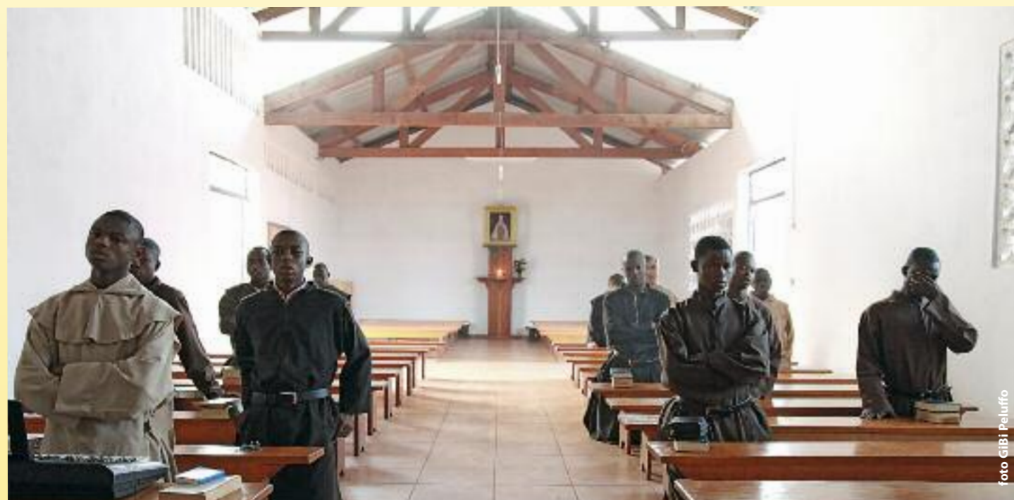
BANGUI, 26 DE NOVIEMBRE DE 2010: NUESTRA ORACIÓN, COMPARTIDA CON LOS JÓVENES QUE SE PREPARAN A SER RELIGIOSOS CARMELITAS, ACOMPAÑA A LOS AMIGOS Y BIENHECHORES DE LAS MISIONES.