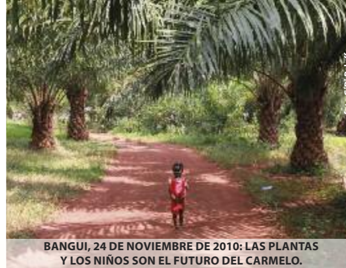
BANGUI, 24 DE NOVIEMBRE DE 2010: LAS PLANTAS Y LOS NIÑOS SON EL FUTURO DEL CARMELO.