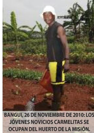
BANGUI, 26 DE NOVIEMBRE DE 2010: LOS JÓVENES NOVICIOS CARMELITAS SE OCUPAN DEL HUERTO DE LA MISIÓN.

Para que este programa vaya adelante, en los