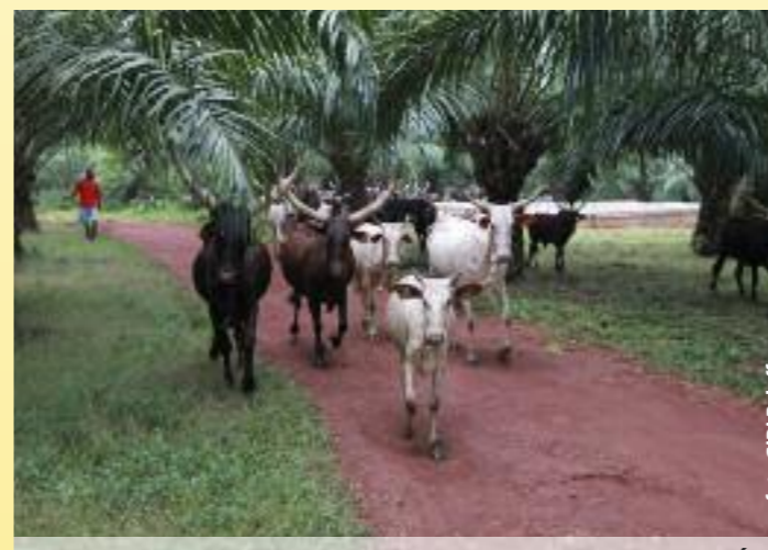
BANGUI, 25 DE NOVIEMBRE DE 2010: EL PALMERAL YA ESTÁ AL COMPLETO CON 15.000 PLANTAS.