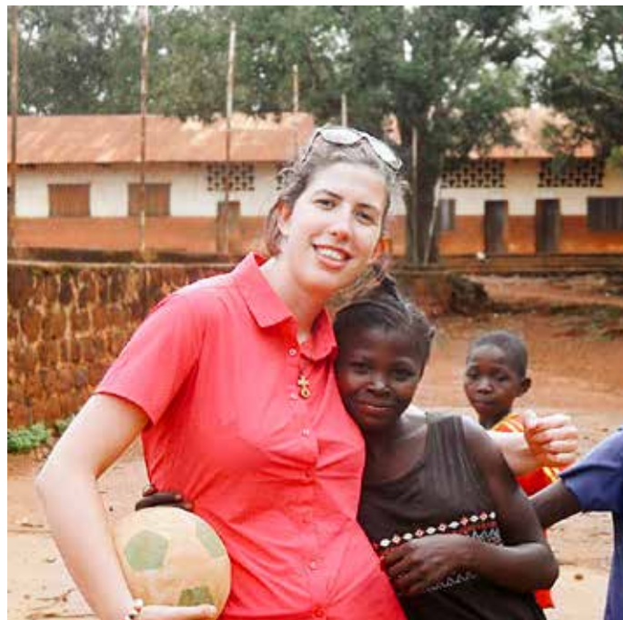
BOZOUM, 2 AGOSTO 2025: OGNI GIORNO IL CORTILE DELLA MISSIONE SI RIEMPIE DI BAMBINI CHE GIOCANO